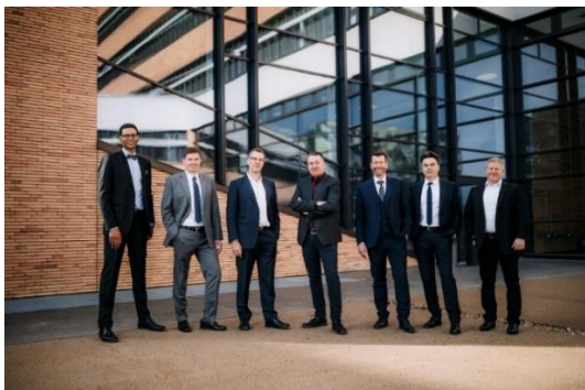
„Vasko+Partner – Geschäftsführung“