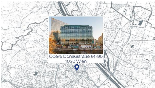
©V+P-JanaStanic-OpenStreetMap_contributors. „Neuer Standort im Zentrum Wiens“