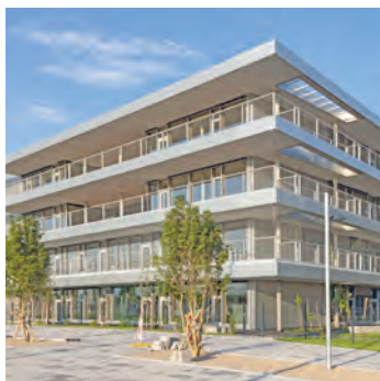
BILDUNGSCAMPUS LISELOTTE HANSEN-SCHMIDT