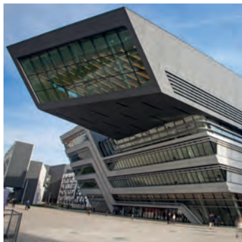
CAMPUS WU