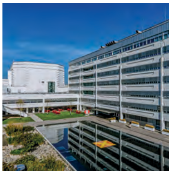
ORF © RKB/BRUNO KLUMFAR