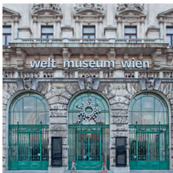
WELTMUSEUM © FRANZ ERTL